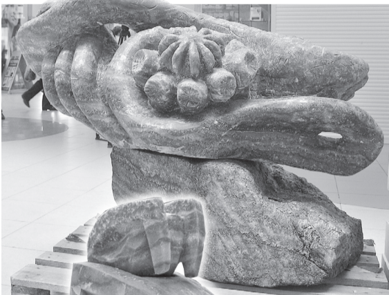
Только в Березниках проходит Международный фестиваль скульптур из сильвинита «Пермское море».

■ Редакция газеты «Березниковский рабочий» совместно с городской администрацией начинает новый проект – издание альманаха «Березники: Книга рекордов».